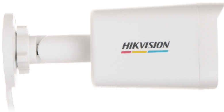
Vista dal lato di montaggio: