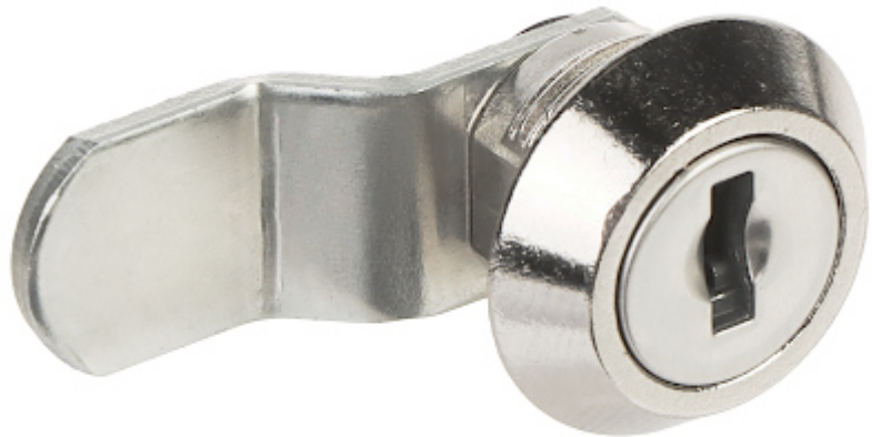
TPR sērijas cilindru slēdzene korpusiem (montāžas kārbām).

Ierīci jāaizsargā no saskares ar kodīgiem, viskoziem un plankumus veidojošiem šķidrumiem.