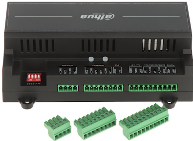
Skats no stiprināmās puses: