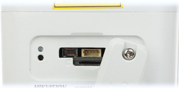
Aanzicht van de kant van de camerabevestiging: