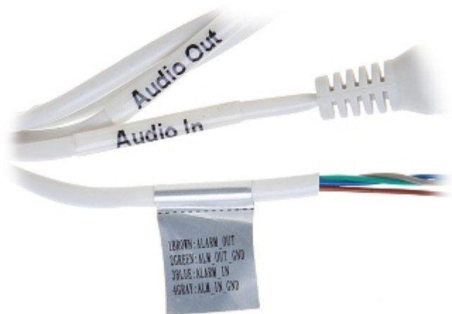
Vy från monteringsida: