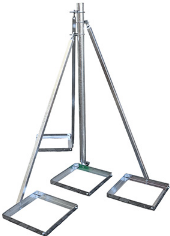
Pohjatukien liittäntä mastoon: