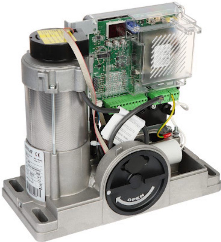
Контролер за задвижване на портата: