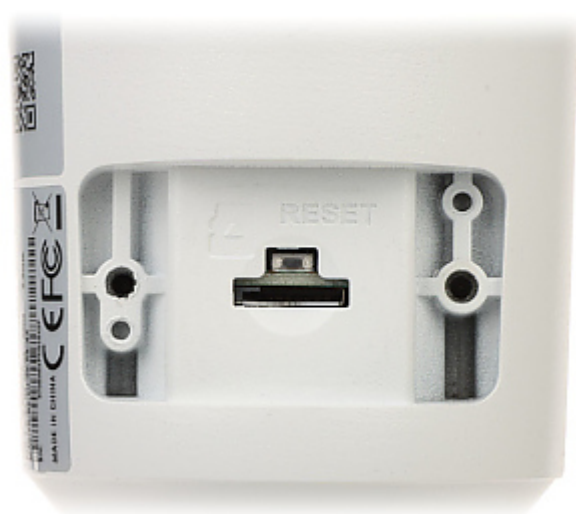
Vue du côté de la fixation de la caméra: