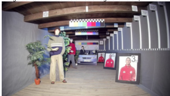
Image de la caméra avec une forte lumière réglée en face de la caméra: