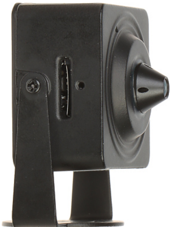
Vue du derrière: