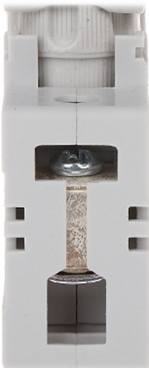
Vedere din spate: