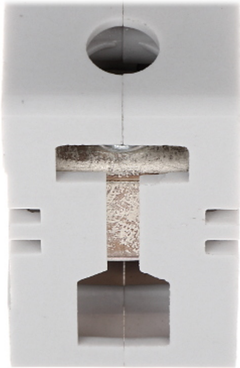
Vedere de sus: