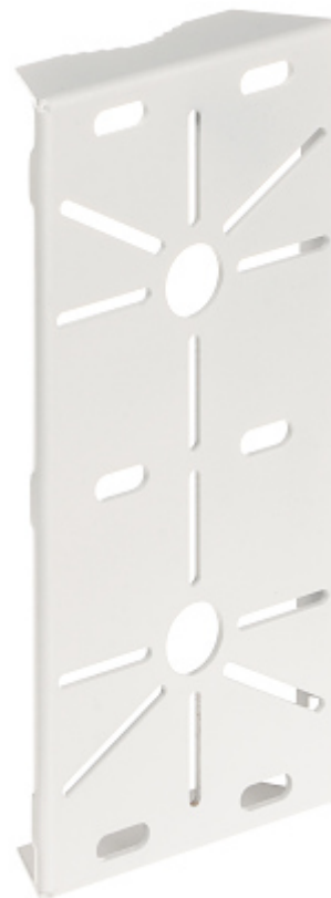
Tabla de montare BM-130X280 este destinată montării camerelor rotunde și tubulare pe catarge. Produsul permite montarea camerelor și a sistemelor de prindere cu diametrul de bază care nu depășește Ø120mm.

Atașarea plăcii de metal la catarg se face prin intermediul unor cleme selectate corespunzător (care sunt disponibile separat). Intervalul dintre orificii permite utilizarea de buloane cu diametrul de până la Ø8mm distanțate adecvat pentru catargele cu diametrele cuprinse între Ø43mm ... Ø200mm.